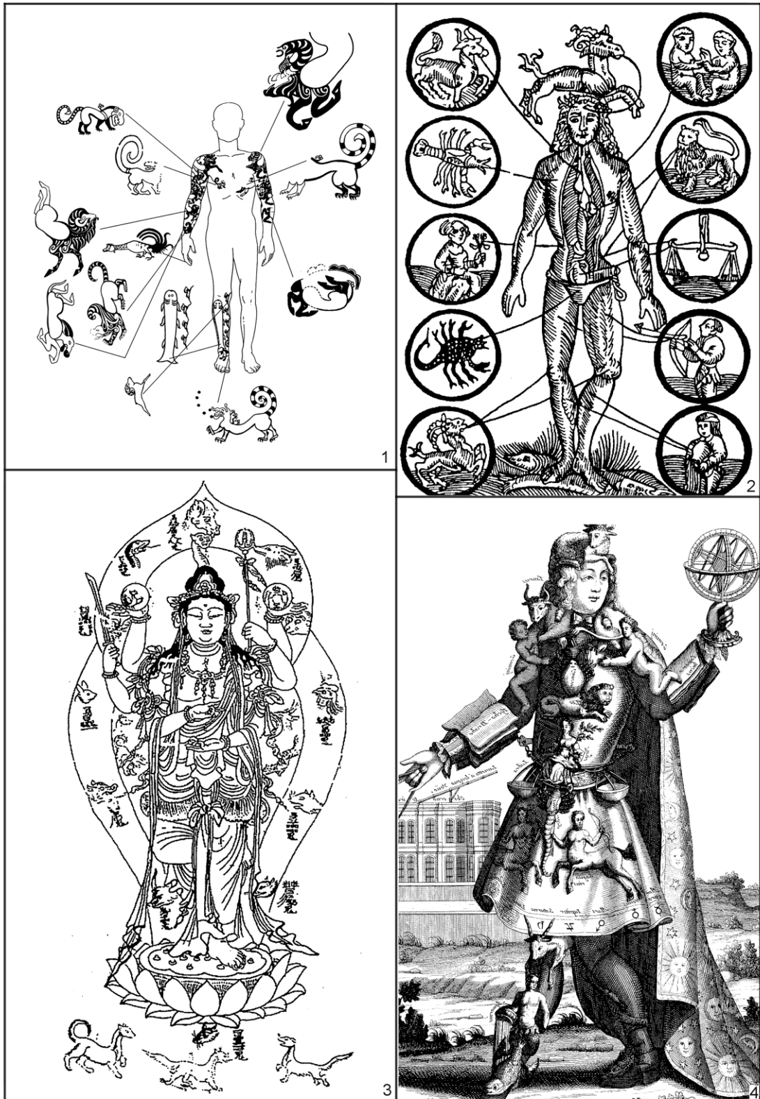
Рис. 2. Рисунки «зодиакального» человека из разных регионов Евразии: