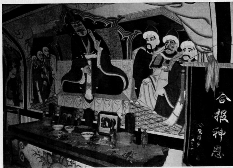
Рис. 3. Центральная композиция в храме

Крестьянин проводил нас до места, где располагалась могила «знатного» кочевника. Там оказалось, что на месте вскрытой и разграбленной могилы стоит небольшой буддийский храм (рис. 2). Жители поселка в период недавних перемен (тоже в условиях обозначившегося самосознания) посчитали сделанные ранее находки необычным знаком, своеобразным знаменем, посланием свыше. Вся эта история к тому времени уже обросла мифами. В конечном итоге местные активисты приняли такое решение: добиться у далай-ламы права воздвигнуть храм в честь своего древнего предка (героя-кочевника). И этот план был реализован. Построенный храм называется «Хэй лун цзян цзюнь». Географические координаты места его нахождения такие: N – 38°42.573'; E – 109°46.165'. Высота над уровнем моря – 1277 м. Перед строительством каменных сооружений была предпринята попытка дополнительно раскопать место, где найдена могила, но повысившийся уровень грунтовых вод не позволил это сделать.