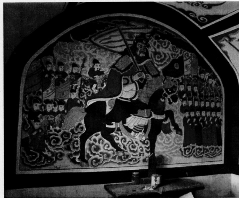
Рис. 4. Боковая сюжетная композиция в храме

мого Бога, которого называют «Полководец черного дракона» (рис. 3). Перед ним также есть жертвенник и остальные необходимые атрибуты для совершения ритуальных действий. Рядом хранятся некоторые вещи нерелигиозного содержания. В других местах на стенах представлены сюжеты героического содержания (рис. 4), символика и отдельные портреты.