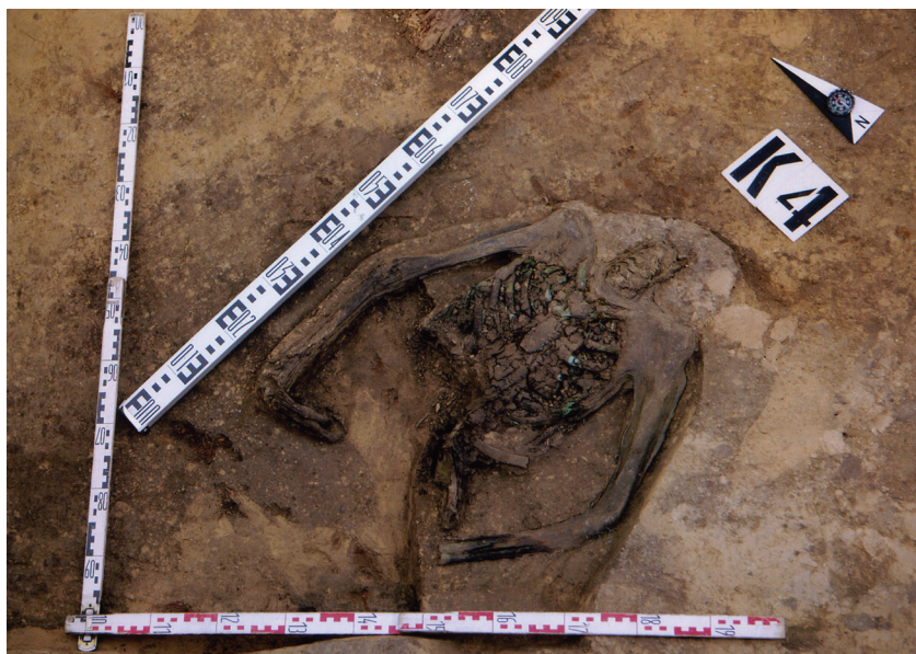
Рис. 2. Бугры. Курган №4. Мумифицированная часть умершей женщины

также на левой руке, у которой отсутствовала кисть (рис. 2). Кроме этого, поблизости найдены отдельные разрозненные кости скелета: фрагменты черепа (височная часть, основание затылочной), фрагмент седалищной кости, первый шейный позвонок и два поясничных. Обнаруженные части черепа оказались довольно грацильными. Ширина первого шейного позвонка составила 72 мм, что соответствует размерам, типичным для женского пола. На поясничных позвонках отмечены остеофиты и грыжи шморля. Костные и мумифицированные останки, скорее всего, принадлежат женщине в возрасте не менее 40 лет (приведенные определения выполнены С.С. Тур). Ребра оказались сильно покрыты окислами меди. Необходимо указать, что на пальцах хорошо сохранившейся кисти правой руки был маникюр. Рядом с «мумией» зафиксированы многочисленные медные бляхи-нашивки, некогда украшавшие погребальный наряд. Часть их покрыта золотой фольгой. Такие изделия могли составлять женский нагрудник. Вероятно, древние грабители, проникшие по дромосу в центральную могилу, вытащили из нее тело погребенной женщины в богатой одежде и сняли драгоценный металл около входа. Кроме различных нашивных блях там найдены фрагменты китайского лака, часть железного изделия, декорированного золотом, и деревянная фигурка хищника (голова утрачена).